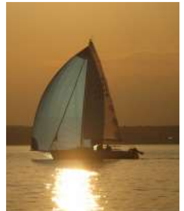
Anton Stäheli's J80 mit Fredy Geisser an der Pinne.

Gleich auf Anhieb glückte der Start und entwickelten sich recht interessante Positionskämpfe an der Spitze. Der Landschlag nach dem