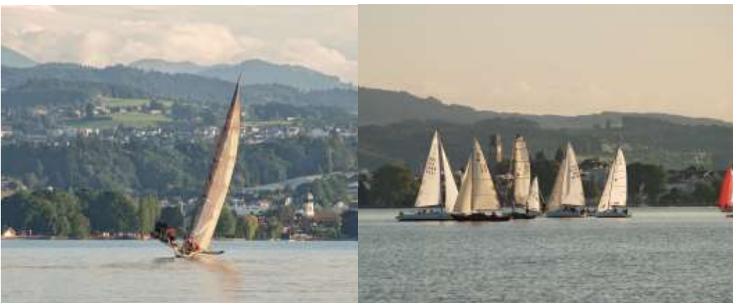
Die Krabelgruppe unterwegs zum nächsten Wind Feld. Während die J's die Esse der Pirat und BB17 bereits den Wind spüren. Das ganze ausserhalb des Regattageschehens.

ende seglerisch gute Bedingungen zu herrschen.