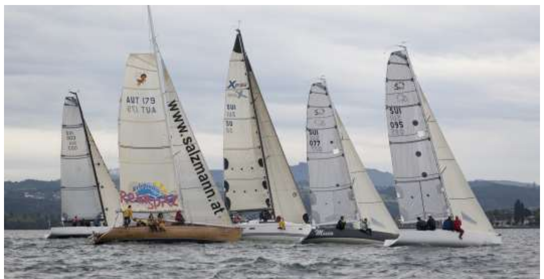
Guter Druck beim Start am Montagabend. Leider hat es nicht für einen gesamten Lauf ausgereicht.