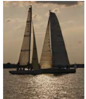
Manöver auf engstem Raum am Freitagabend. (Yemaja und Solaris)

Gestern konnten die Teilnehmer mit Zuversicht auslaufen. Es stand eine leichte Biese, die bereits den ganzen Tag einen abendlichen Lauf in Aussicht stellte. Da endlich der Wind für das erste Race wehte, bewegten sich die Teilnehmer früh aus dem Hafengelände, in Erwartung eines spannenden Rennens. Man spürte bald, dass wohl alle richtig heiss darauf waren zu starten und man drängelte sich an, oder auf der Startlinie. Schon früh