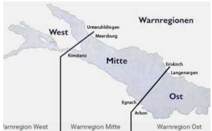
Die drei Sturmwarnregionen, West, Mitte und Ost Der Sturmwarndienst wird von der Regionalzentrale Stuttgart in Zusammenarbeit mit MeteoSchweiz durchgeführt.

Da der Abend mit Temperaturen um 24°C und Sonnenschein sehr angenehm war, blieben einige in Hafennähe auf dem Wasser und feilten an ihren Manövern. Sowohl