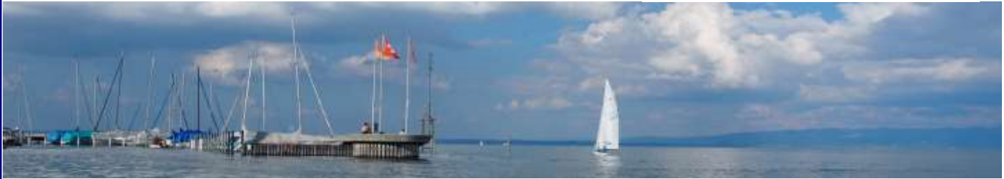
Der Star von Otmar Elsener. Links die bedrohliche Gewitterzelle vor Friedrichshafen.