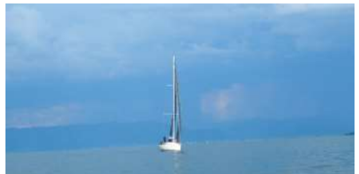
Die Gewitterzelle aus dem Rheintal, die teilweise bis Lindau reichte aber mehr oder weniger im Rheintal stationär blieb.

auf der Misia wie auch auf der IMX 38, wurden Gennaker bzw. Spinakermanöver geübt. Andere wiederum