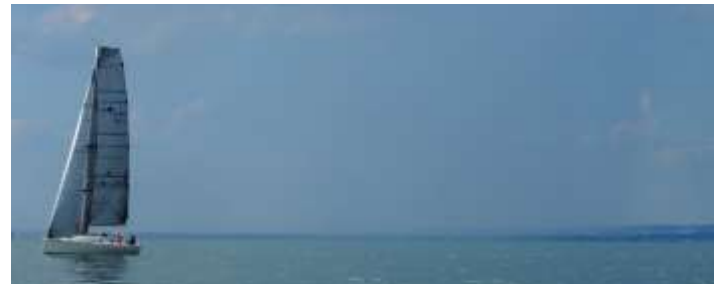
Die Gewitterzelle über Friedrichshafen, die anschließend bedrohlich weit in den See zog.