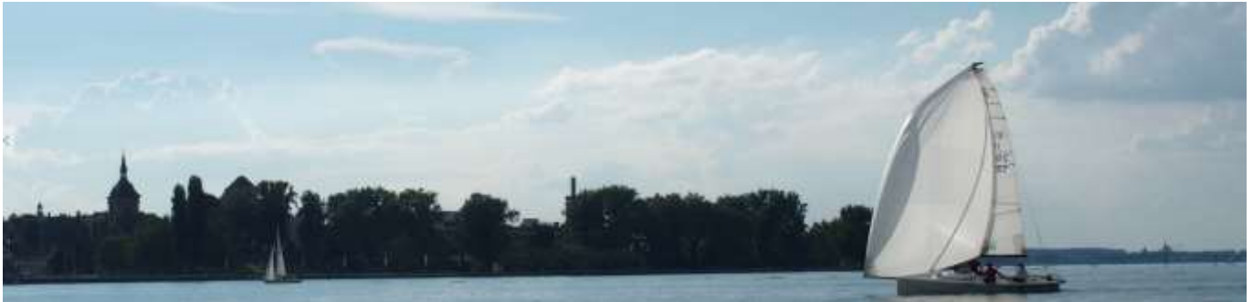
... andere feilten noch etwas an ihren Manövern. Vorbildlich blieben alle in Hafennähe

entleerte. Doch weder der Glitsch noch das Gewitter wurde uns beschert.