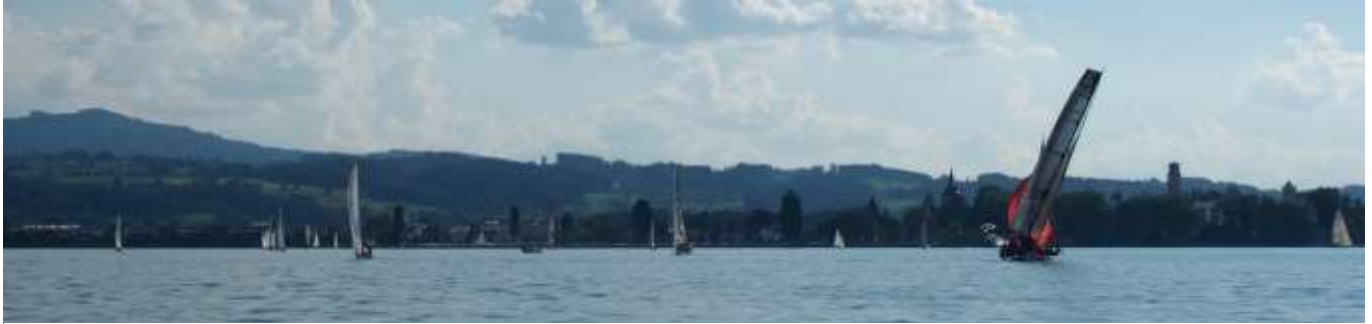
Nach dem die Sturmwarnung aktiviert wurde, kehrten einige in den Hafen zurück ...