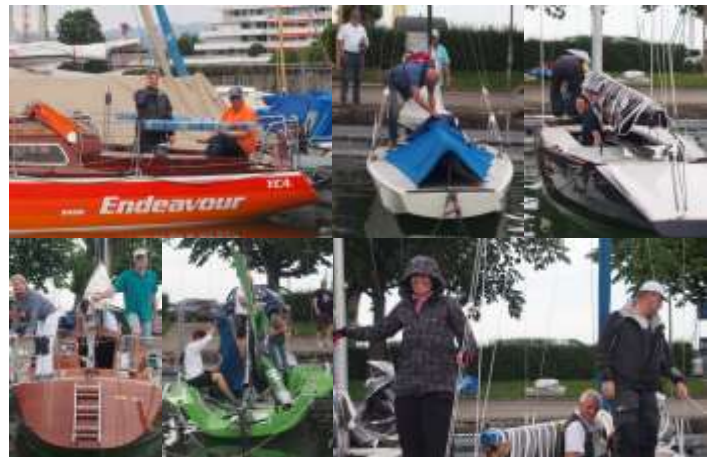
Startvorbereitung. Wenig Hektik, Ruhe und Freude vor dem Auslaufen.

Der Stimmung im Zelt hat dies nicht getrübt. Das Essen, ein Riindsstroganoff mit Reis, hat diese nochmals positiv beeinflusst.