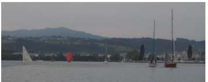
Beim Auslaufen stand noch ein leichter Südwest.