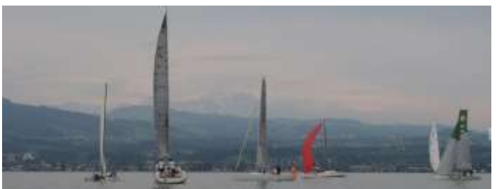
... und dann verabschiedet sich der Wind.

Angeregte Diskussionen, viele lachende Gesichter und bei der Verlosung interes-