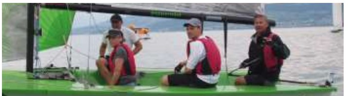
Die letzten Fragen werden noch geklärt ...